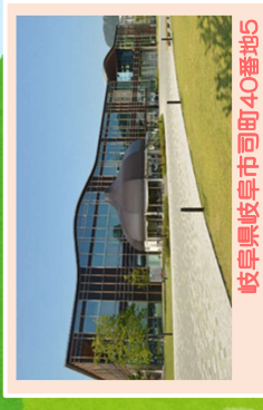
岐阜県岐阜市町40番地5

◆車でお越しの場合 有料駐車場 約300台 (30分/100円) ※割引認識設備使用で入庫後2時間まで無料。