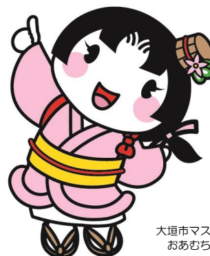
大垣市マスコットキャラクター おあむちゃん