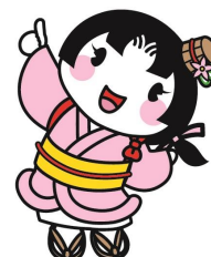
大垣市マスコットキャラクター おあむちゃん